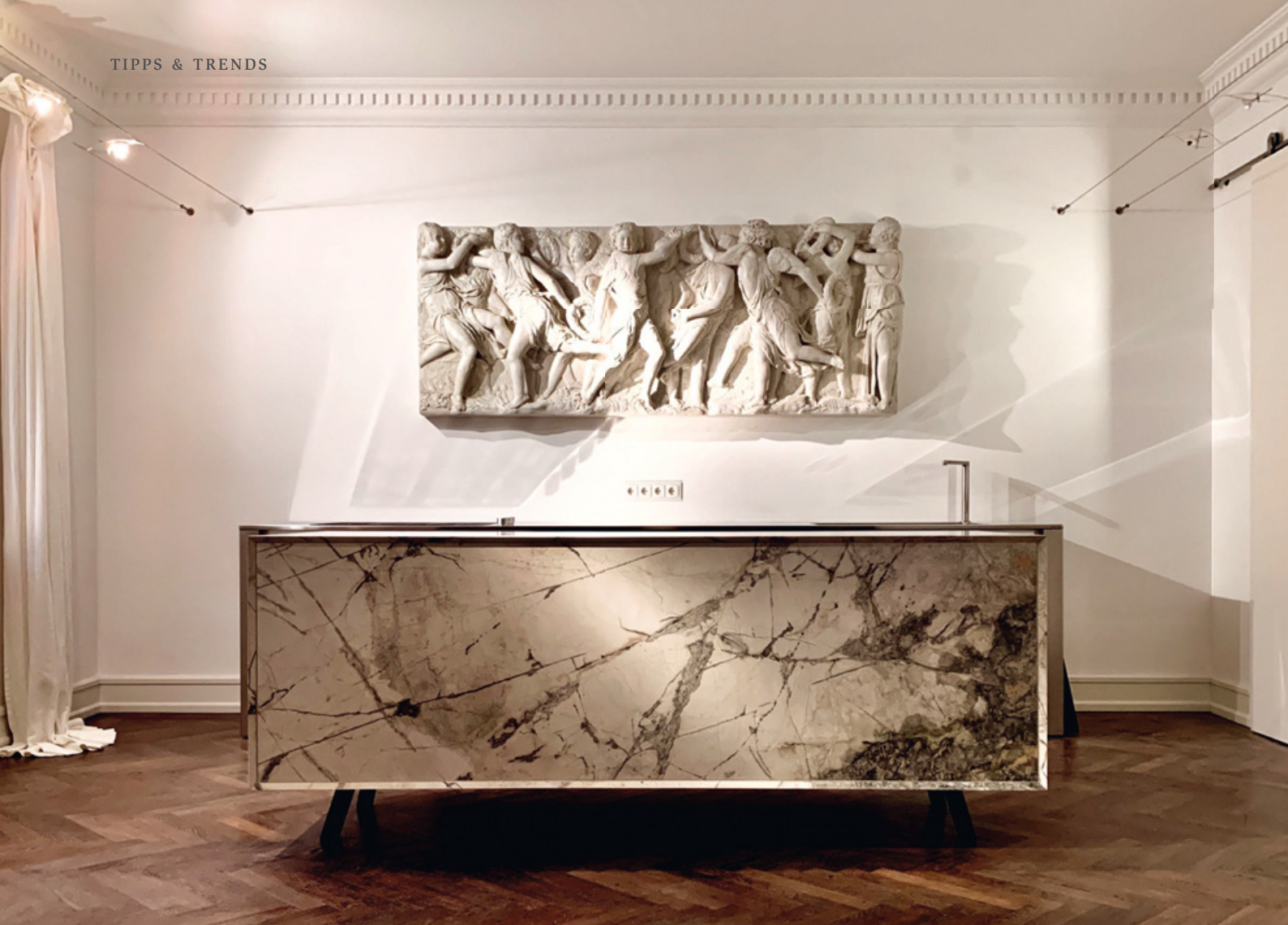
Purismus in der Küche: »n'Stee Aristokrat« aus dem Marmor INVISIBLE GREY von MCR