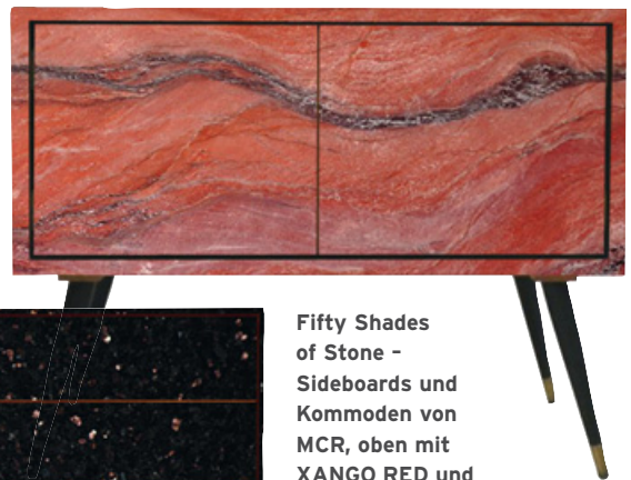
Fifty Shades of Stone - Sideboards und Kommoden von MCR, oben mit XANGO RED und links mit STAR GALAXY