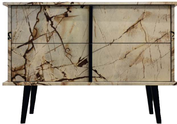
Fifty Shades of Stone - Kommode aus SPIDERMAN CLASSIC

Küchenblock »n'Stee Aristokrat« aus dem Hartgestein NERO MILANO mit Intarsien aus dem Marmor INVISIBLE GREY