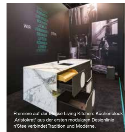
Premiere auf der Messe Living Kitchen: Küchenblock 'Aristokrat' aus der ersten modularen Designlinie n'Stee verbindet Tradition und Moderne.