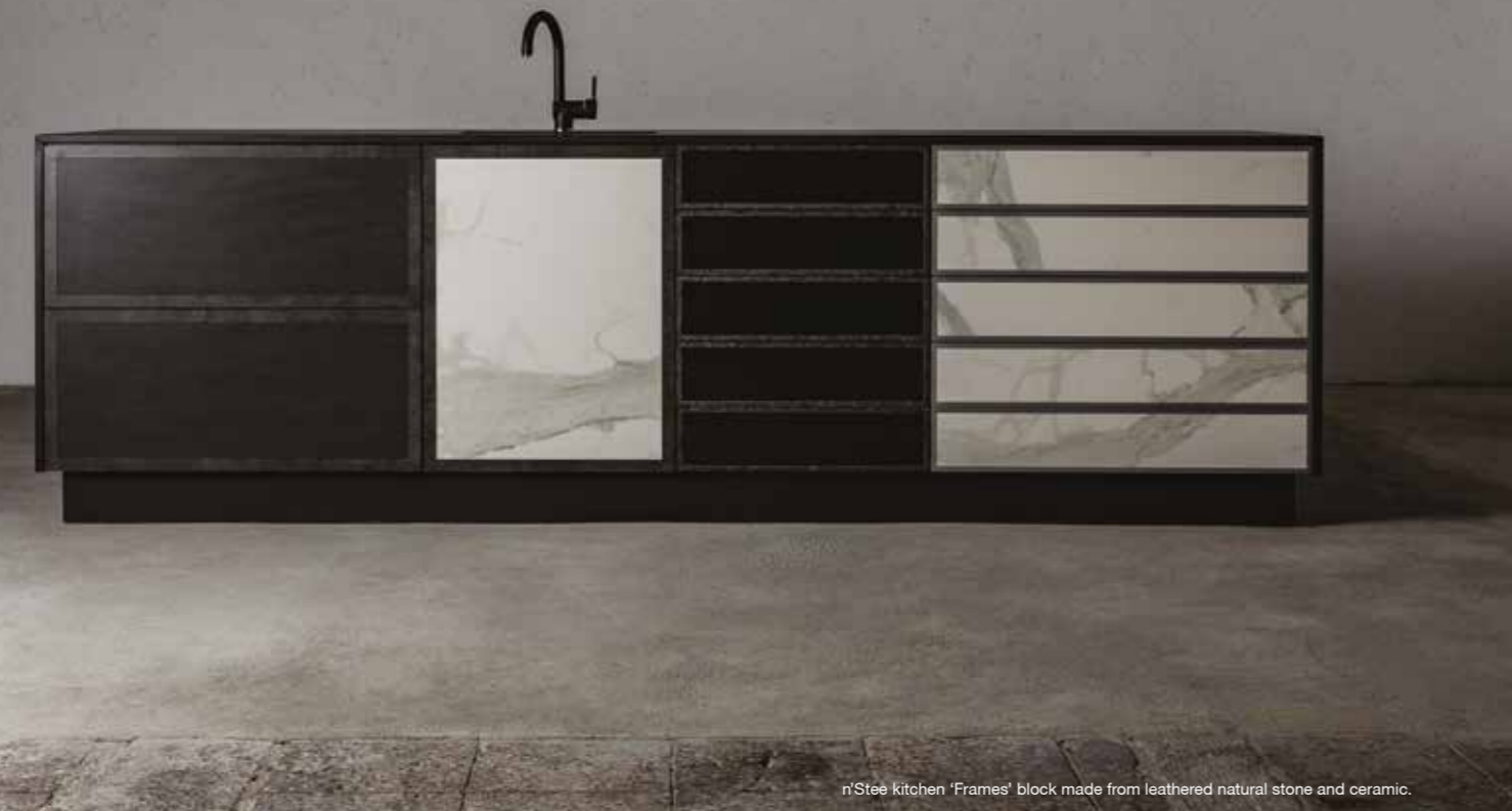
n'Stee kitchen 'Frames' block made from leathered natural stone and ceramic.