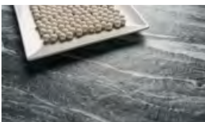
Neolith Mar Del Plata

Unsere Fotoreportage zur LivingKitchen finden Sie unter https://bit.ly/2TUFlxB