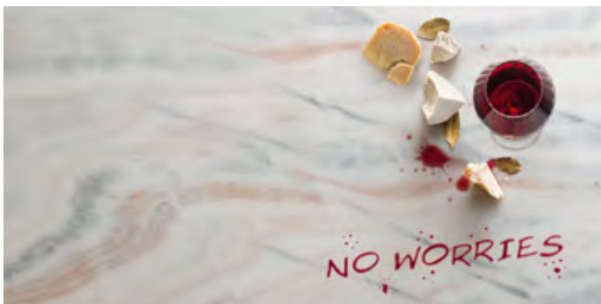
Gegen Agressorien wie Rotwein und Fett gut geschützt ist diese Küchenplatte aus dem bei Antolini verfügbaren Marmor BIANCO LASA/COVELANO FANTASTICO.

Anwendungen der Werkstoffe inszeniert. Im Rahmen täglicher Kochveranstaltungen begeisterte das auch auf der BAU vertretene Unternehmen (s. S. 14) etliche Besucher für die kratz- und hitzebeständige Großkeramik Laminam. Antolini zeigte Küchenblöcke aus BRONZE AMANI und GREY STONE poliert vor entsprechenden Wandbekleidungen in der Oberflächenbearbeitung