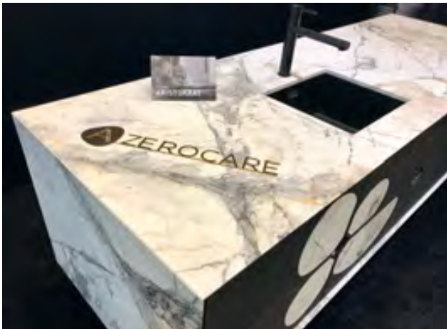
Detailansicht des aus dem Marmor ARISTOKRAT gefertigten und mit dem Schutz »Azerocare« von Antolini behandelten Küchenblock bei MCR