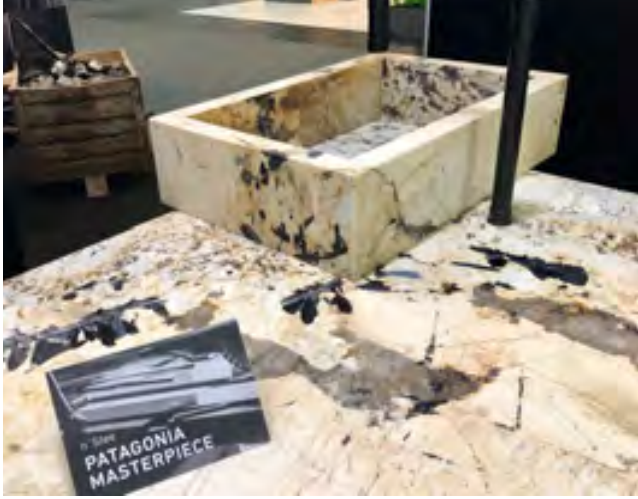
Detail des Unikats aus PATAGONIA auf dem LivingKitchen-Stand von MCR