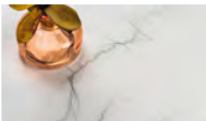
Neolith Mont Blanc