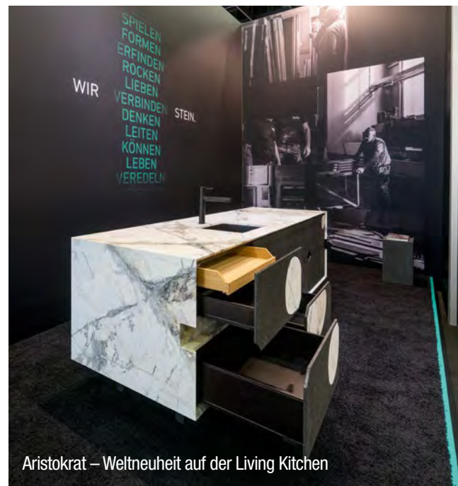
Aristokrat – Weltneuheit auf der Living Kitchen

Eine Vielfalt, die seinesgleichen sucht und die man nur verwirklichen kann, wenn man mit Stein kann. Richtig gut – in allen Dimensionen.