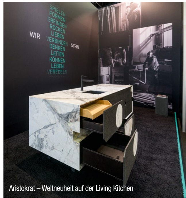
Aristokrat – Weltneuheit auf der Living Kitchen

Eine Vielfalt, die seinesgleichen sucht und die man nur verwirklichen kann, wenn man mit Stein kann. Richtig gut – in allen Dimensionen.